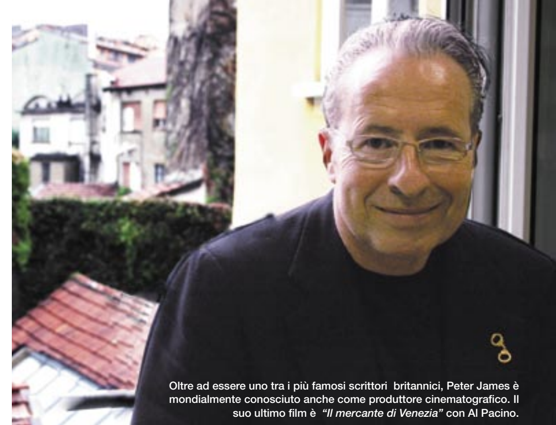
Oltre ad essere uno tra i più famosi scrittori britannici, Peter James è mondialmente conosciuto anche come produttore cinematografico. Il suo ultimo film è "Il mercante di Venezia" con Al Pacino.

«L'interesse per il paranormale deriva più che altro da me. Mi sono sempre interessato a questo argomento e anche alle case visitate dai fantasmi. Dodici anni fa il capo della polizia del Sussex mi disse una cosa molto speciale. Gli chiesi infatti se i poliziotti si fossero mai rivolti ai medium per risolvere dei casi. Lui mi rispose che in effetti è una pratica molto in uso perché anche se il pubblico ritiene che il poliziotti si muovano solo attraverso regole ben stabilite, quando l'indagine finisce in un vicolo cieco spesso il parere dei chiaroveggenti si rivela molto utile. Ad esempio, quindici anni fa nel Regno Unito c'è stato il caso di una ragazzina che era scomparsa e la polizia si è rivolta a una medium che ha indicato agli inquirenti dove si trovava il corpo, purtroppo ormai defunto della poveretta. E poi ci sono i fenomeni Xfiles degli Stati Uniti, e non mi riferisco alla fiction televisiva, ma a tutti quei